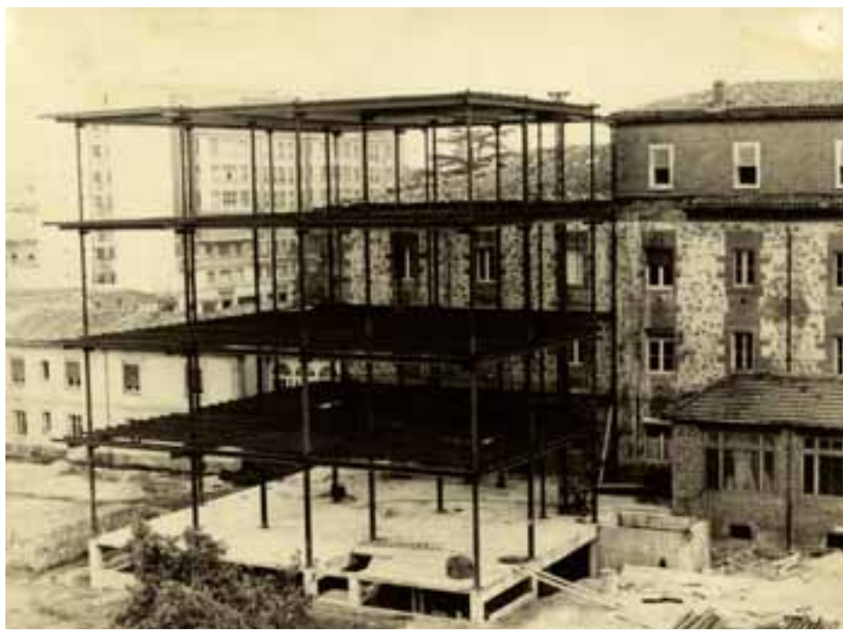
Obras de la ampliación del Hospital Santiago de Vitoria, en el año 1969. A. S. Koch

La empresa, que se mantiene firme en el mercado , está certificada por Aenor con los sellos de Calidad ISO 9001, Medio Ambiente ISO 14001, y Seguridad y Salud OHSAS 18001.